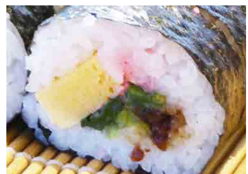
田舎巻き (20cm) 庄原産もみじたまごと庄原野菜を使用した定番巻寿司。 500円