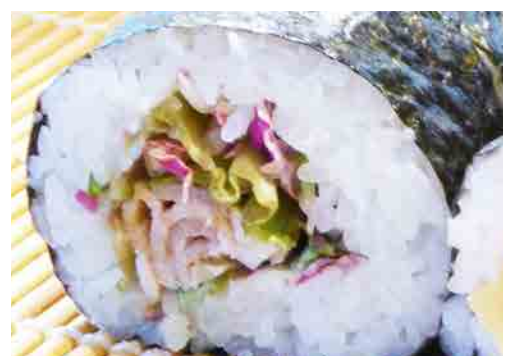
瀬戸もみじ豚 生姜焼き巻き (20cm) 生姜焼きと庄原野菜を組み合わせた巻寿司。 500円