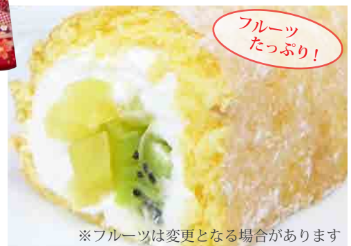
庄原産フルーツロール (10cm) 高野りんごのコンポートを使用したフルーツロール。 300円