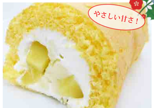
雪室じゃがいもロール (10cm) 雪室で熟成されたじゃがいものゴロッとロール。 300円