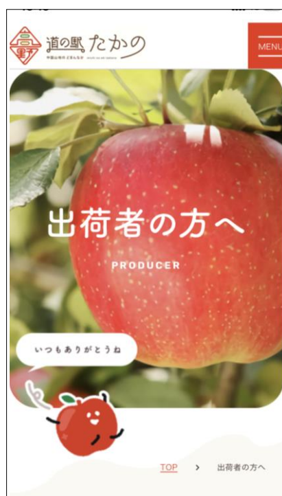
出荷者専用ページを 新たに開設

現在集荷を利用されている方、 遠方にお住まいでなかなか来られ ない方でも、ホームページを見れ ば売り場の様子がひと目でわかる ように、これからどんどん改良し ていきますので、どしどしご意 見・ご要望をお寄せ下さい♪