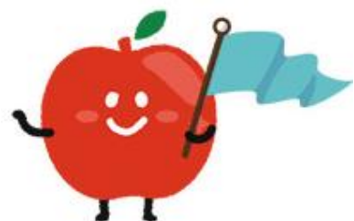
新マスコットの「りんちゃん」

スマホは持っているけど、見方 がイマイチわからないという出荷 者の方！道の駅スタッフが全力で サポートしますのでお気軽にご相 談下さい！