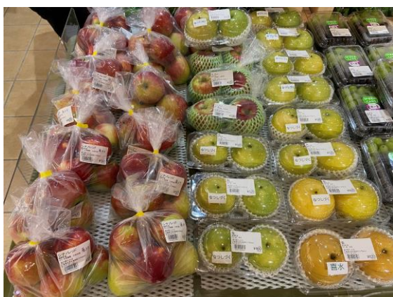
この時期の直売所はりんご、梨、ぶどうなど果物が充実。