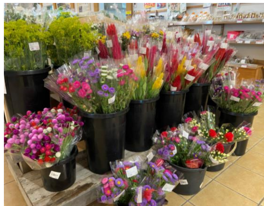
お盆期間はお供え用のお花がとても良く売れました♪