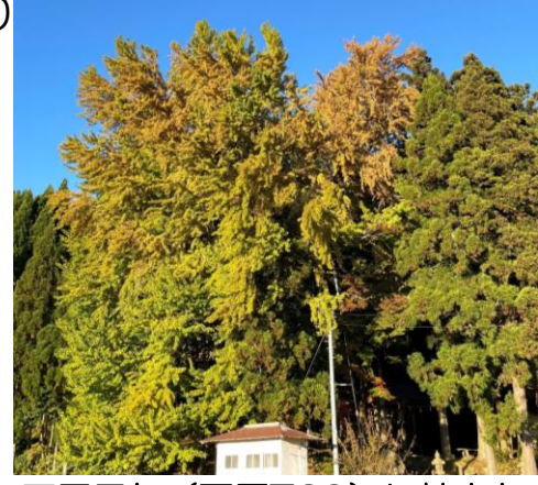
天平元年(西暦729)に神木として植えられたと伝えられている天満神社の乳下がりの大銀杏

とはいえ、お客様の目的はりんご、大根、新米などの農産物が中心です。出荷者の皆さんには精力的に出荷していただいておりますが、多くのご来場により売り切れてしまう状況が続いております。農作業や冬支度で大変お忙しい中ですが、行楽シーズンをしっかり乗り切る為にも、少量の出荷でも構いませんので充実した売場作りへの出荷協力をよろしくお願ひします。